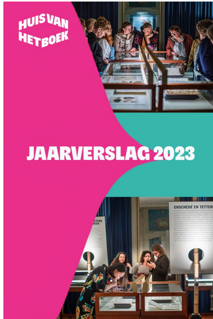
Afbeelding openingsweekend presentatie Flora Batava