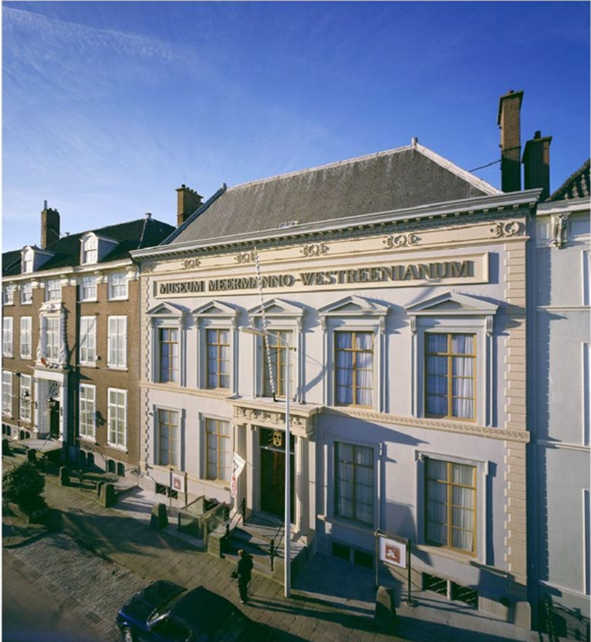
Den Haag, 3 mei 2026